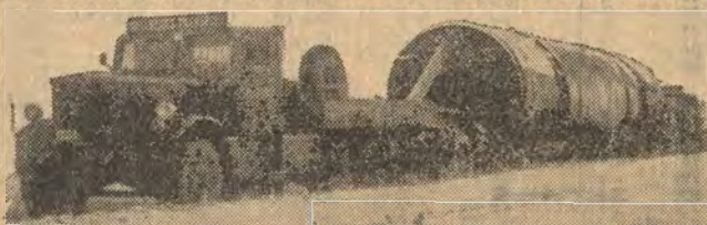
En av våra längre transporter, 35 tons torktrumma. Hela ekipagens längd 54 m.