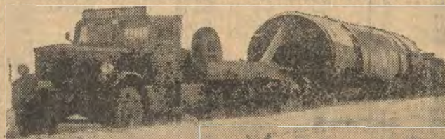
En av våra längre transporter, 35 tons torktrumma. Hela ekipaget längd 54 m.