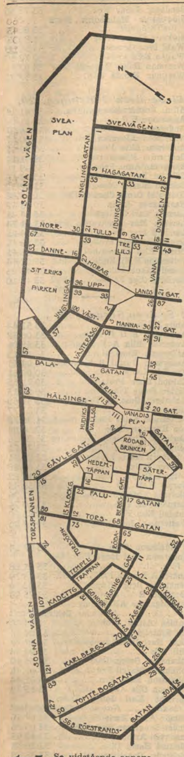
Se vidstående annons