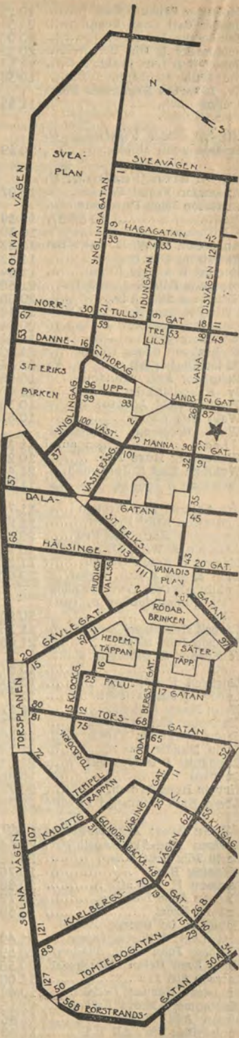
Se vidstående annons